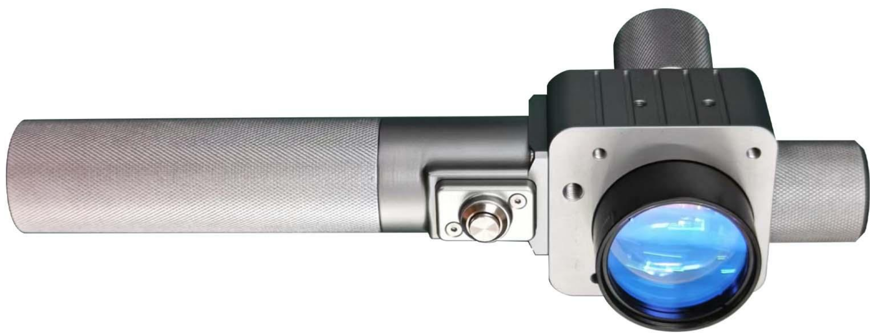
手持头尺寸: 260mm * 65mm * 83mm