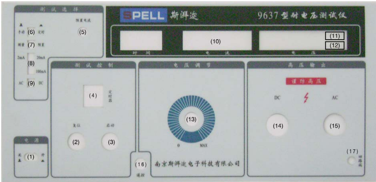
图（2）数显式耐压测试仪前面板示意图