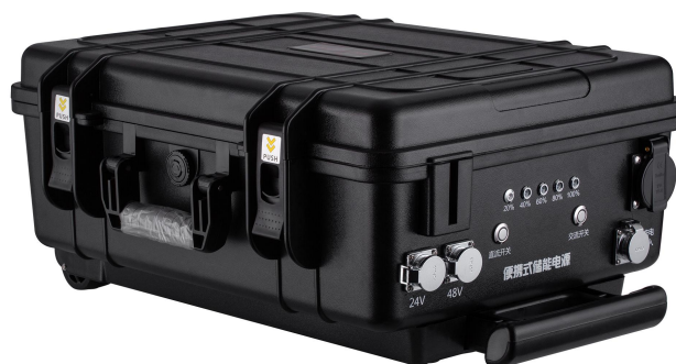
产品外部图片 〈二〉 External Picture(II)