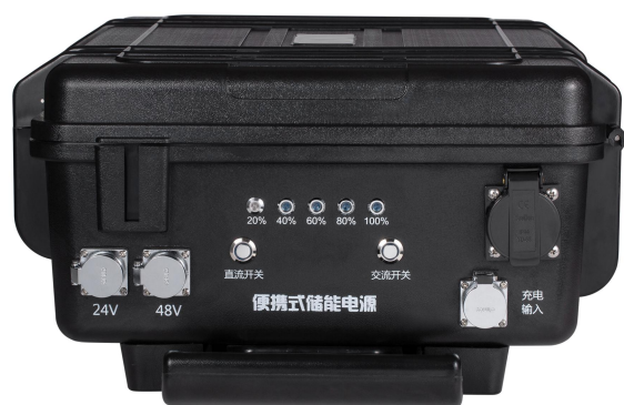
产品外部图片 〈一〉 External Picture(I)